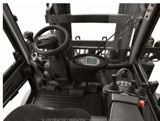
* ILUSTRACNÍ OBRÁZEK * WWW.MOJEMT.CZ *