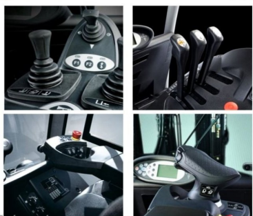
* ILUSTRACNÍ OBRÁZEK * WWW.MOJEMT.CZ *