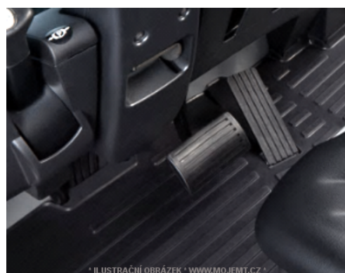
* ILUSTRACNÍ OBRÁZEK * WWW.MOJEMT.CZ *