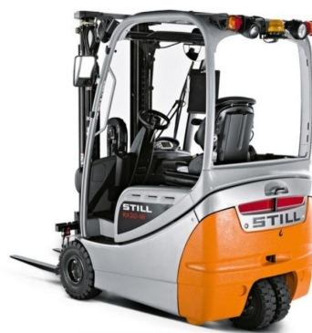
* ILUSTRACNÍ OBRÁZEK * WWW.MOJEMT.CZ *