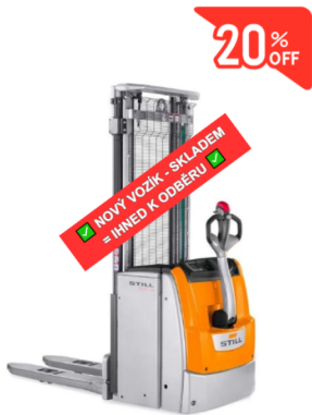
* ILUSTRÁČNÍ OBRÁZEK * WWW.MOJEMT.CZ *