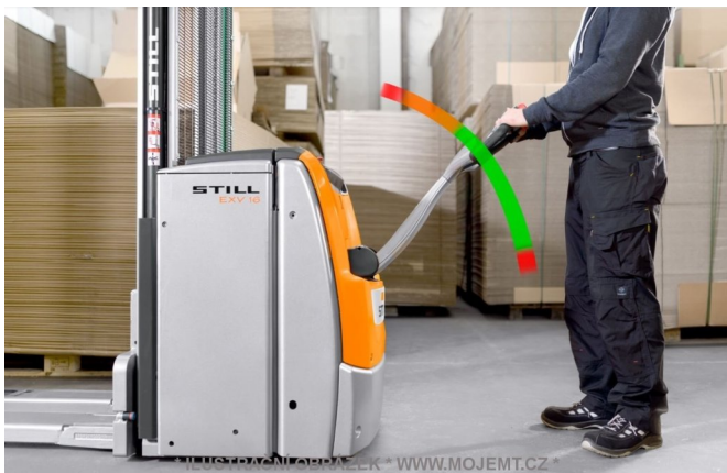
* ILUSTRÁČNÍ OBRÁZEK * WWW.MOJEMT.CZ *