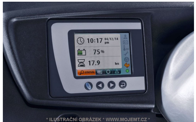
* ILUSTRÁČNÍ OBRÁZEK * WWW.MOJEMT.CZ *