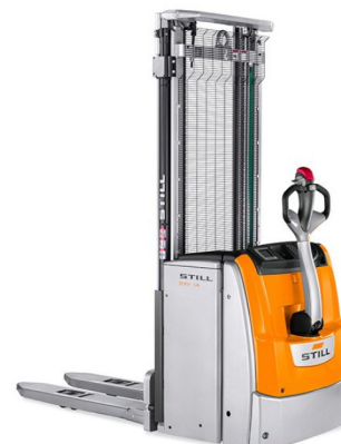
* ILUSTRÁČNÍ OBRÁZEK * WWW.MOJEMT.CZ *