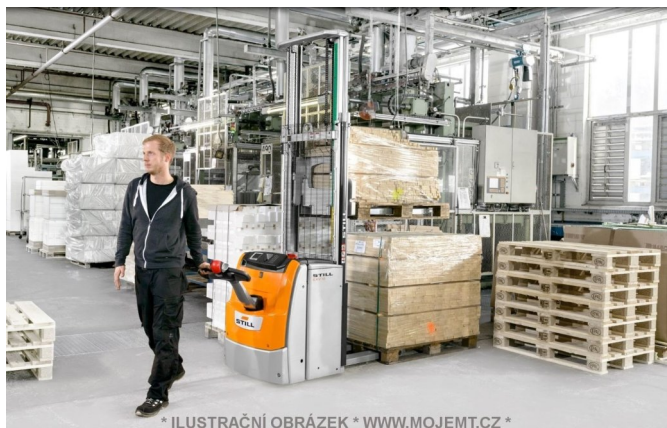
* ILUSTRÁČNÍ OBRÁZEK * WWW.MOJEMT.CZ *