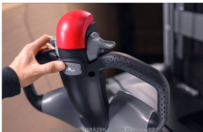
* ILUSTRÁČNÍ OBRÁZEK * WWW.MOJEMT.CZ *