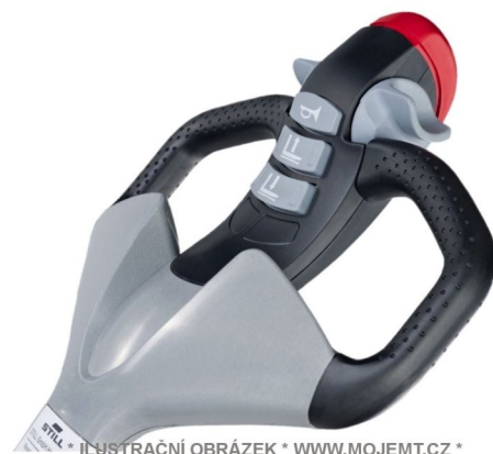
* ILUSTRÁČNÍ OBRÁZEK * WWW.MOJEMT.CZ *