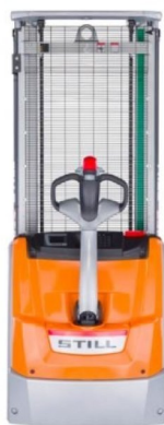
* ILUSTRÁČNÍ OBRÁZEK * WWW.MOJEMT.CZ *