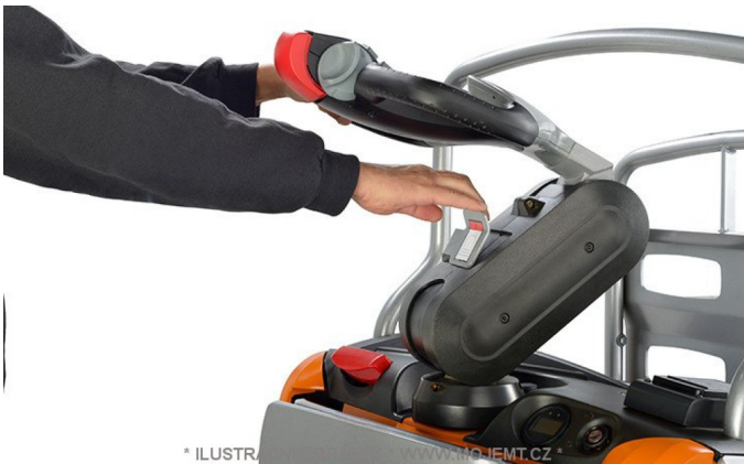
* ILUSTRÁČNÍ OBRÁZEK * WWW.MOJEMT.CZ *