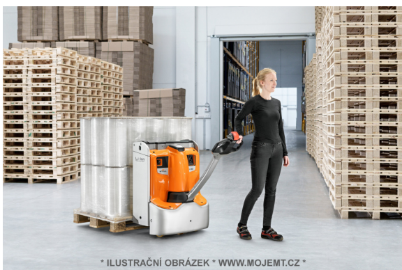
* ILUSTRÁČNÍ OBRÁZEK * WWW.MOJEMT.CZ *