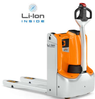
* ILUSTRÁČNÍ OBRÁZEK * WWW.MOJEMT.CZ *