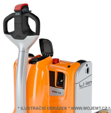
* ILUSTRÁČNÍ OBRÁZEK * WWW.MOJEMT.CZ *