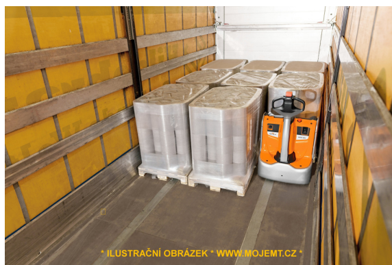
* ILUSTRÁČNÍ OBRÁZEK * WWW.MOJEMT.CZ *