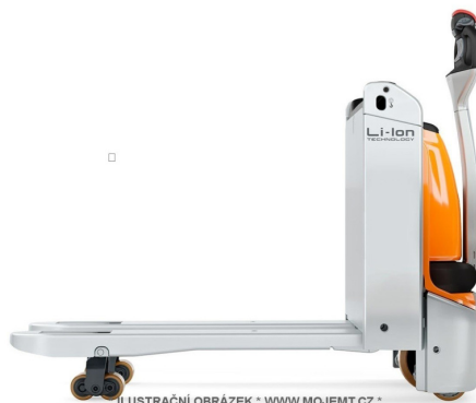
* ILUSTRÁČNÍ OBRÁZEK * WWW.MOJEMT.CZ *