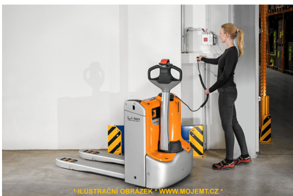
* ILUSTRÁČNÍ OBRÁZEK * WWW.MOJEMT.CZ *