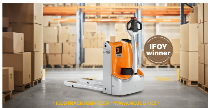
* ILUSTRÁČNÍ OBRÁZEK * WWW.MOJEMT.CZ *