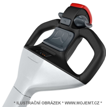
* ILUSTRÁČNÍ OBRÁZEK * WWW.MOJEMT.CZ *