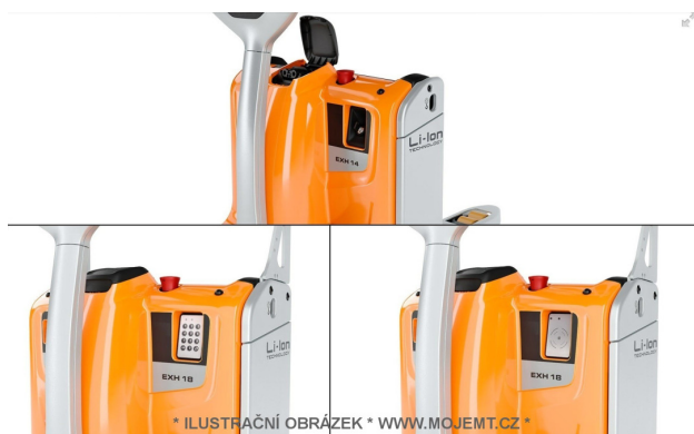
* ILUSTRÁČNÍ OBRÁZEK * WWW.MOJEMT.CZ *