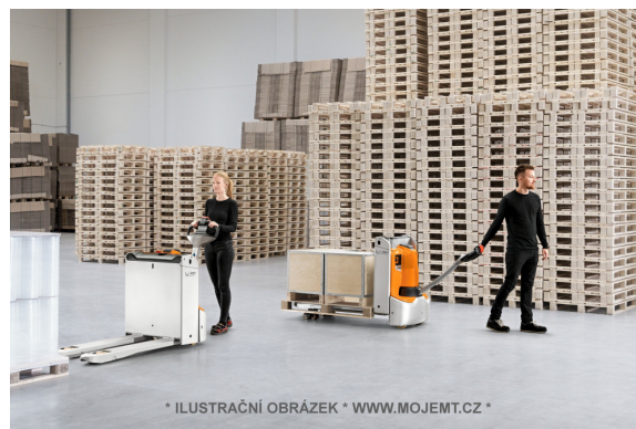
* ILUSTRÁČNÍ OBRÁZEK * WWW.MOJEMT.CZ *