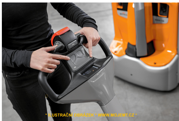
* ILUSTRÁČNÍ OBRÁZEK * WWW.MOJEMT.CZ *