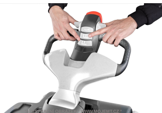
* ILUSTRACNÍ OBRÁZEK * WWW.MOJEMT.CZ *