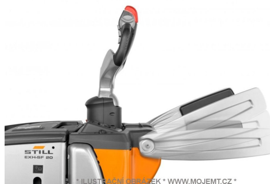
* ILUSTRACNÍ OBRÁZEK * WWW.MOJEMT.CZ *