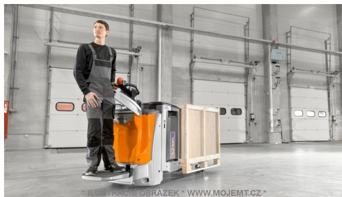
* ILUSTRACNÍ OBRÁZEK * WWW.MOJEMT.CZ *