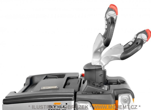
* ILUSTRACNÍ OBRÁZEK * WWW.MOJEMT.CZ *