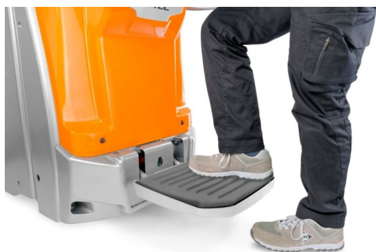
* ILUSTRACNÍ OBRÁZEK * WWW.MOJEMT.CZ *