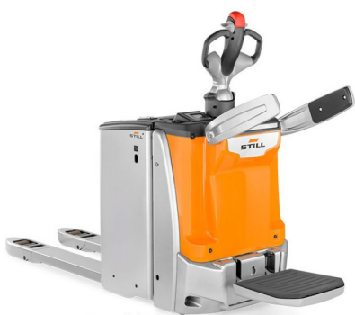
* ILUSTRACNÍ OBRÁZEK * WWW.MOJEMT.CZ *