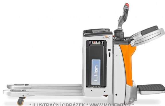
* ILUSTRACNÍ OBRÁZEK * WWW.MOJEMT.CZ *